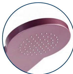
Pomme de douche intégrée

Matière : Aluminium Hauteur : 228 cm Pomme de douche effet pluie mitigeur & rince pieds inox Garantie 2 ans Disponible en 3 coloris