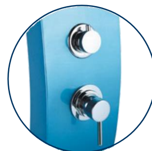
Mitigeur et sélecteur inox