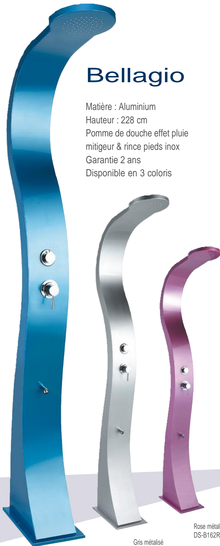
Bleu métallisé DS-B162BL