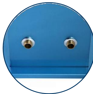
Raccords standards eau chaude / froide